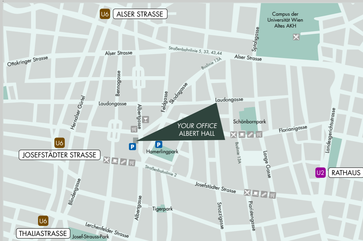
Anfahrtsplan ALBERT HALL